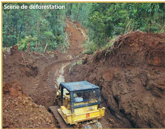
Scène de déforestation